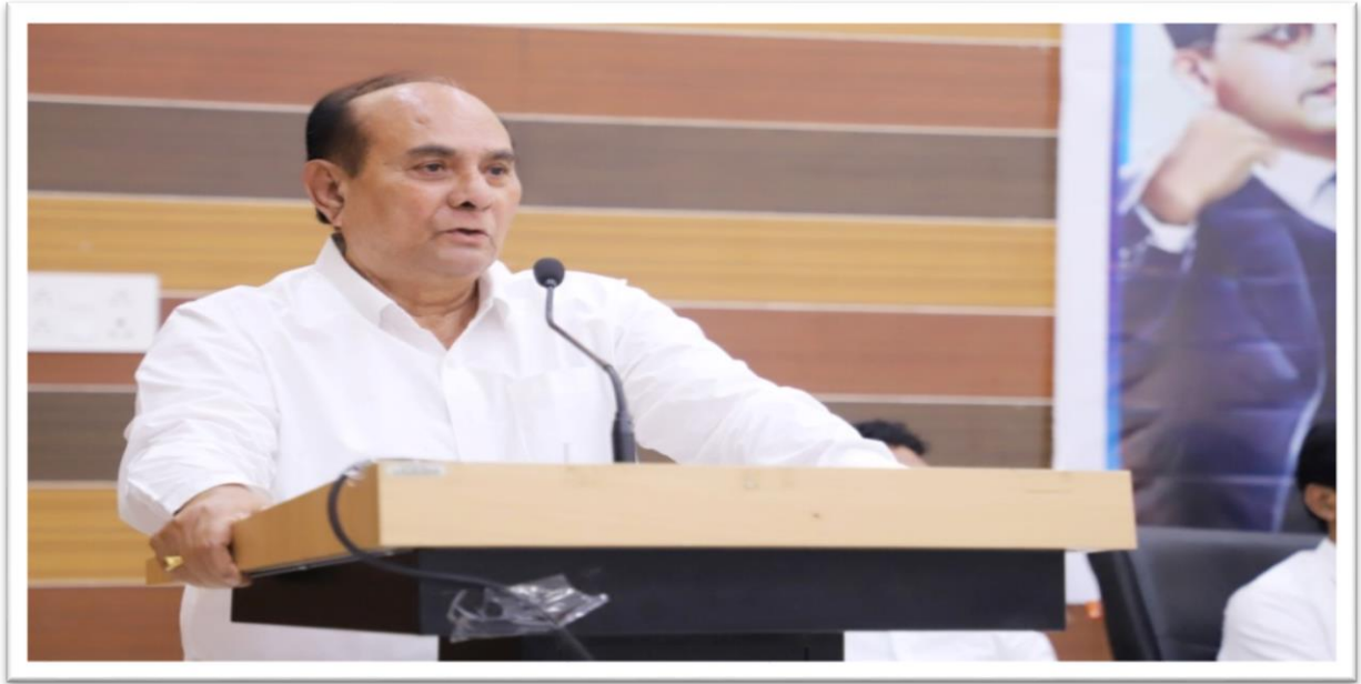
President Hon'ble Arunji Ghotekar delivered the Presidential speech of the main program