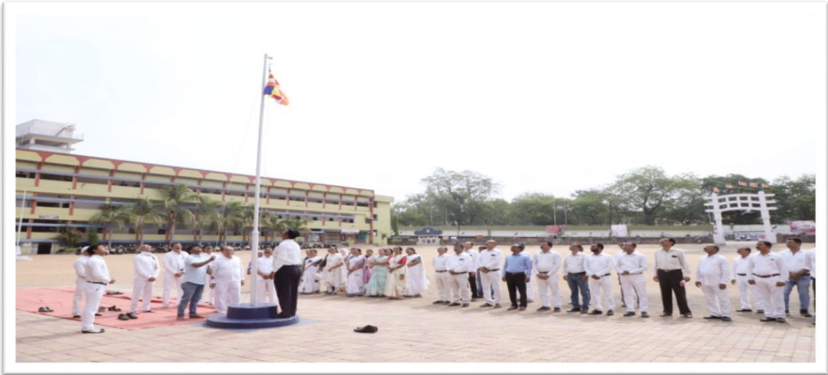
The main program started with Dhamma flag hoisting and Mass trisharana and Panchashil at Dikshabhoomi..