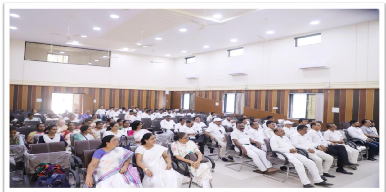
A large number of students, teaching and non-teaching staff of the college, eminent citizens were present.